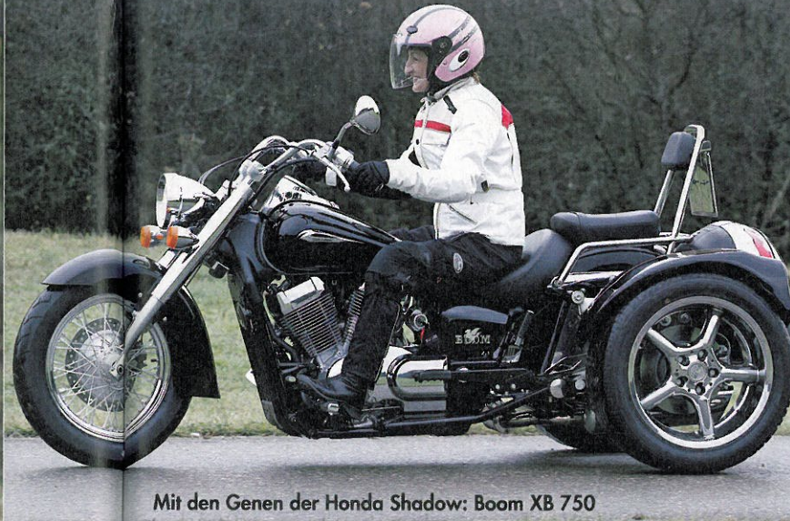
Mit den Genen der Honda Shadow: Boom XB 750